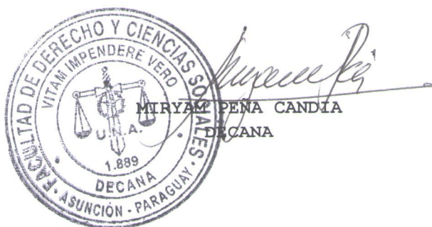
MIRYAM PEÑA CANDIA DECANA